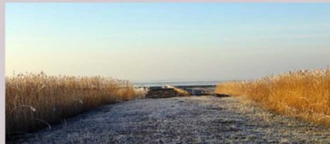
Buttje Pad Kanalpolder