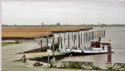
Petkum - Fähre