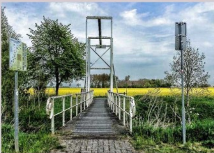
Noaberbrug Bad Nieuweschans

Dat werd voornamelijk georganiseerd door de internationale Rode Hulp en de KPD Emden. De ruimhartige hulp en ondersteuning door Nederlandse helpers, vooral uit de CPN, die daarbij hun leven riskeerden, heeft veel mensen het leven gered.